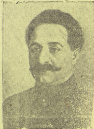
На снимке: Г. К. Орджоникидзе.

Триумфальное шествие Советской власти по стране было прервано весной 1918 года иностранной интервенцией и организацией белогвардейских армий на юге и на востоке России. Началась гражданская война.