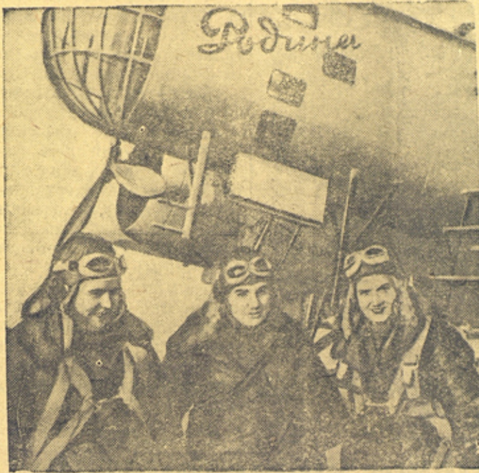
На сн. (слева-направо): П-й пилот самолета „Родина“ капитан-орденоносец П. Д. Осипенко, командир экипажа, депутат Верховного Совета СССР, орденоносец В. С. Гризодубова и штурман самолета, старший лейтенант-орденоносец М. М. Раскова у самолета „Родина“.