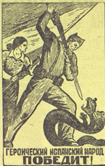
ГЕРОИЧЕСКИЙ ИСПАНСКИЙ НАРОД ПОБЕДИТ!

Плакат художников И. Долгополова и Ю. Узбякова, выпускаемый Госуд. Издательством «Искусство» к XXI годовщине Великой Октябрьской Социалистической Революции.