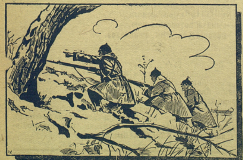
На Дальне-Восточной границе

(„На защиту родины“ № 17, от 24/VIII 38 г.).