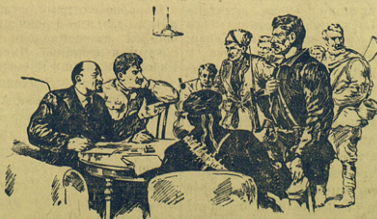
В. И. ЛЕНИН и И. В. СТАЛИН в Смольном.