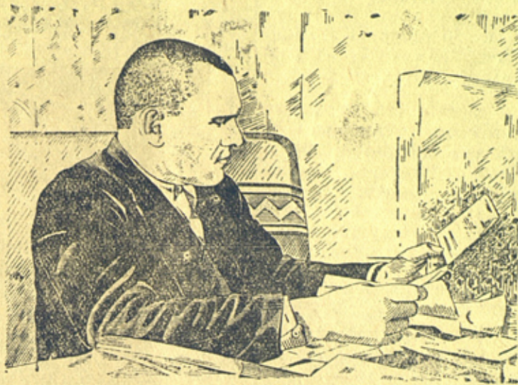
На рисунке: Тов. Ф. И. Гринько просматривает свою дневную почту.