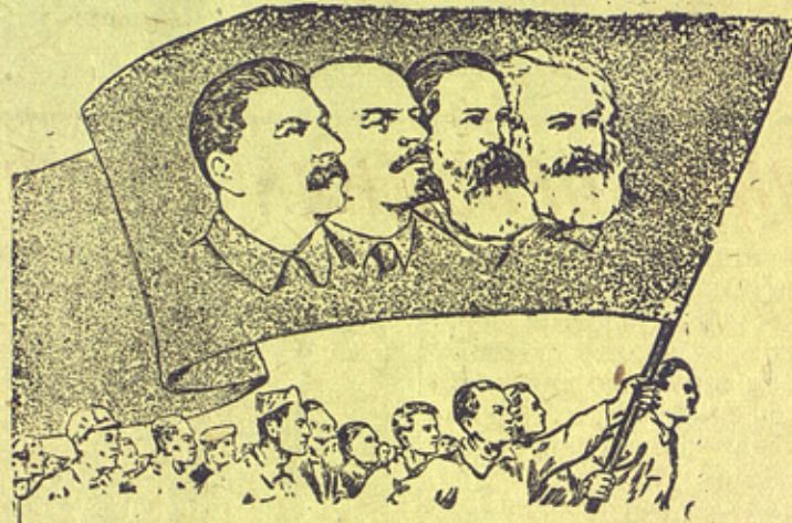
ВЫШЕ ЗНАМЯ МАРКСА-ЭНГЕЛЬСА-ЛЕНИНА-СТАЛИНА!

Рис. с репродукции (Союзфото) „Пресскляше“.