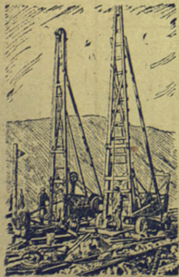
На рисунке: Бурильные станки за подготовкой скважины для взрыва руды амоналом. Рисунок с фото Б. Федосеева. (Прессклише).

Более миллиарда тонн апатитовых руд залегает в районе г. Кировска (Мурманская область). Крупнейшие в мире Кировские апатитовые рудники выдали с момента эксплуатации 8,5 миллионов тонн руды. Обогательная фабрика в г. Кировске превращает апатитовую руду, этот „камень плодородия“, в тончайший порошок — апатитовый концентрат, который как ценнейшее удобрение развозится на колхозные и совхозные поля нашей родины.