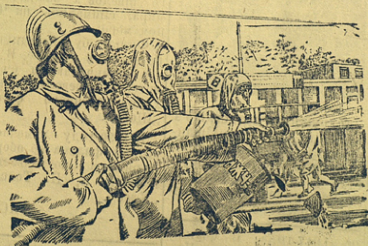
На рис. Отряд рабочей дружины ПВХО за дегазацией площади после налета самолетов „противника“.