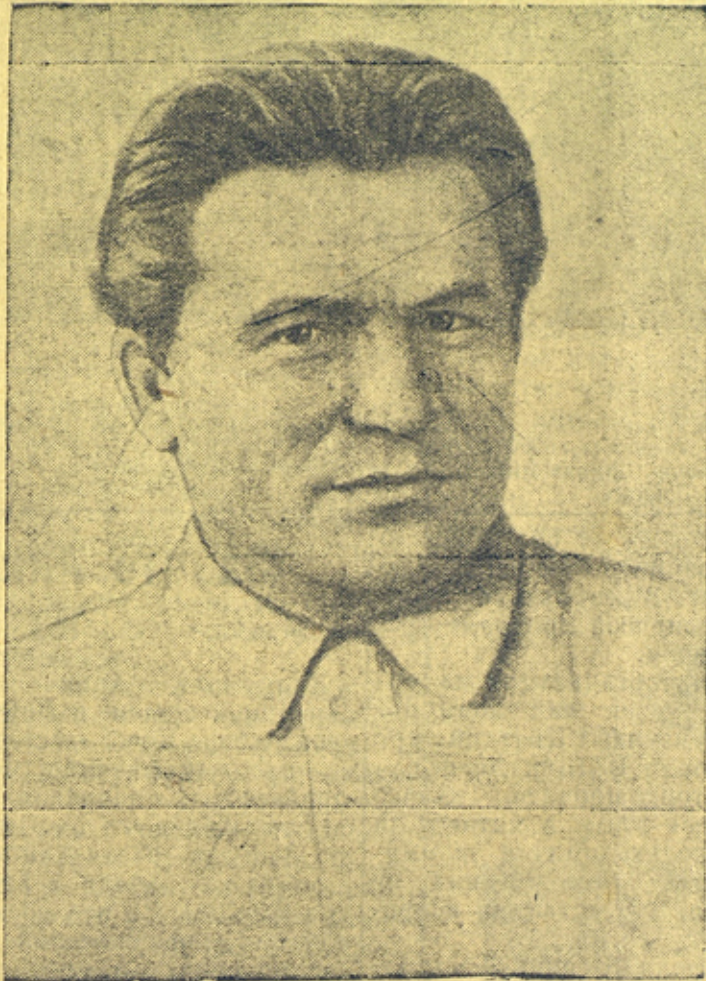
На снимке: С. М. Киров.

1 декабря 1934 года не стало Сергея Мироновича Кирова, верного ученика и соратника товарища Сталина, страстного и непримиримого борца за генеральную линию партии, беспощадно громившего троцкистов, зиновьевцев, правых — всех этих заклятых врагов партии и народа, шпионов, убийц, диверсантов, изменников родины, агентуру фашизма.