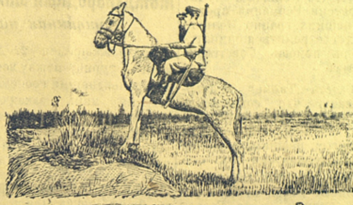
На рисунке: Пограничник Н-ской заставы в дозоре.

Рисунок с фото комсомольца-пограничника Е. Халдея.