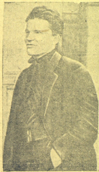
На снимке С. М. Киров