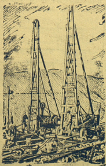
Рисунок с фото Б. Федосеева. (Пресклинше)

На рисунке: бурильные станки за подготовкой скважин для взрыва руды аммионалом.