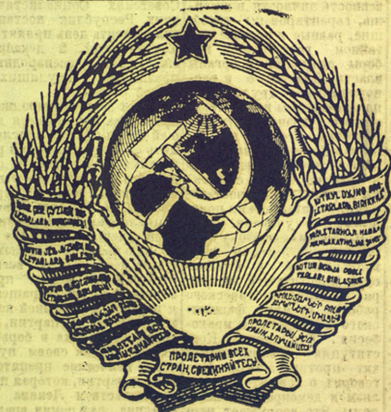
Государственный герб Союза ССР