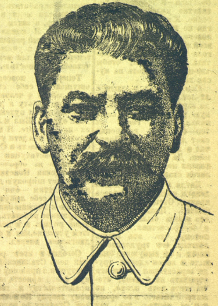
И. В. Сталин

В этот день всемирного праздника все мысли, чувства и горячая любовь трудящихся будут обращены к своему великому другу, к учителю, к вождю народа — великому Сталину, творцу единственной в мире до конца демократической Конституции, который своим мудрым руководством, гениальной прозорливостью и непреклонной волей обеспечил торжество социализма в нашей стране.