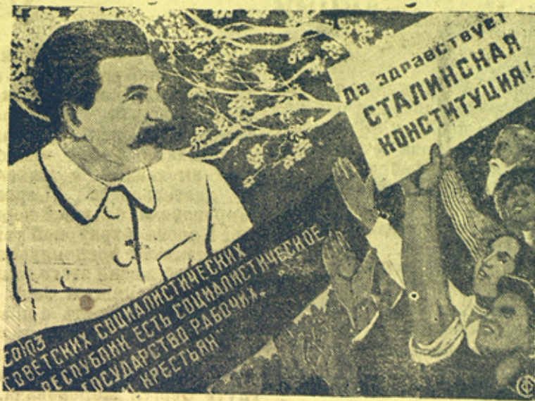
„Да здравствует Сталинская Конституция.“