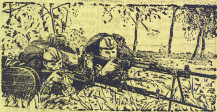
На рисунке: Бойцы на огневой позиции.