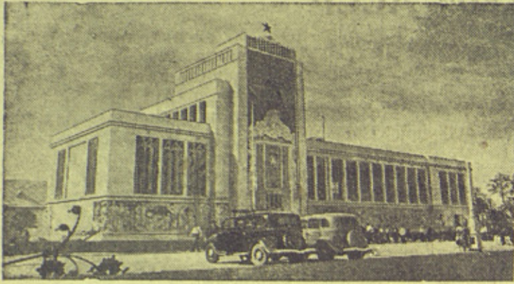
На снимке: Внешний вид павильона Московской, Рязанской и Тульской областей.

На Всесоюзной Сельскохозяйственной выставке.