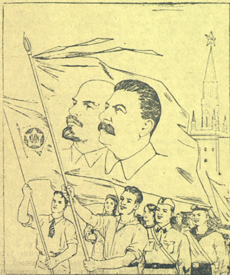
Рисунок художников Н. Денисова и Н. Ватолиной.