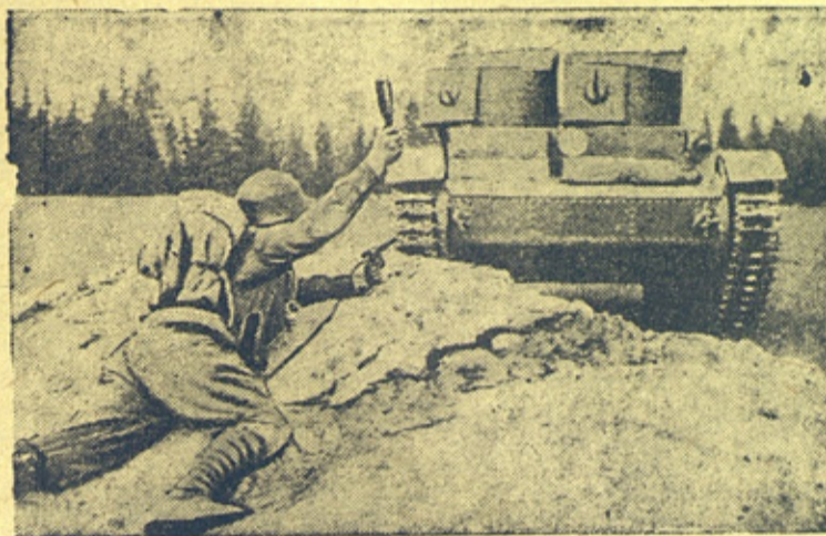
На снимке: Красноармеец тов. Дутов бросает гранату под танк „противника“.

На тактических учениях Н-ской части Белорусского Особого военного округа.