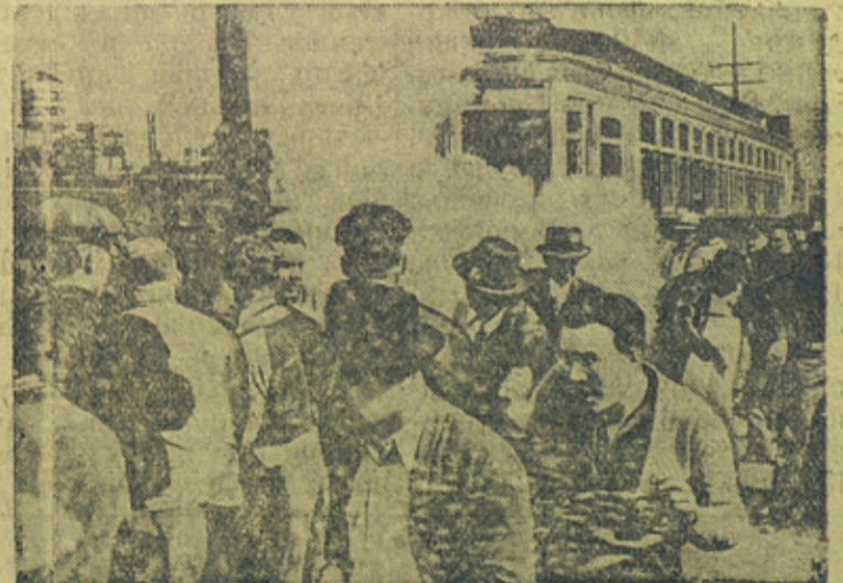
На снимке: Момент разрыва газовой гранаты среди пикета бастующих.

Во время недавней забастовки рабочих одного из заводов в Милуоки (США) пикеты бастующих пытались воспрепятствовать проезду на территорию завода трамвайного вагона, в котором перевозили штрейкбрехеров. Произошла стычка с сопровождавшей трамвай полицией; во время стычки полиция применила слезоточивый газ.