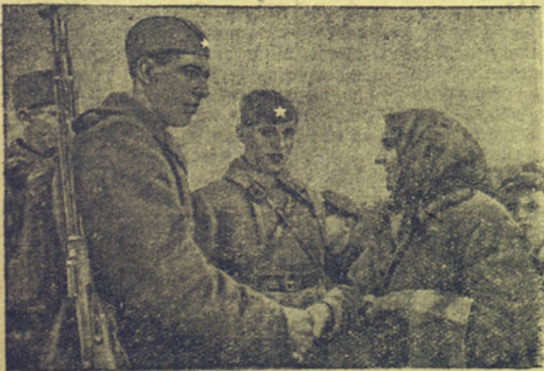
На снимке: Старая крестьянка приветствует бойцов и командиров (м. Молодечно).