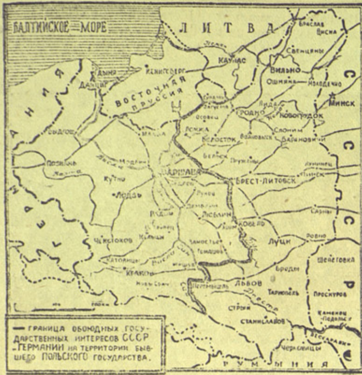
Карта с обозначением границы обоюдных государственных интересов СССР и Германии на территории бывшего Польского государства.