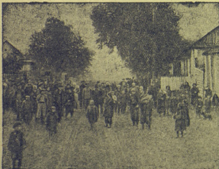
На снимке: Население города Ракова встречает вступившие в город части Красной Армии.