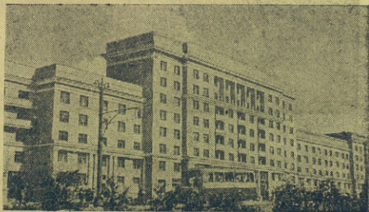
На снимке: Новый жилой дом на Ярославском шоссе.