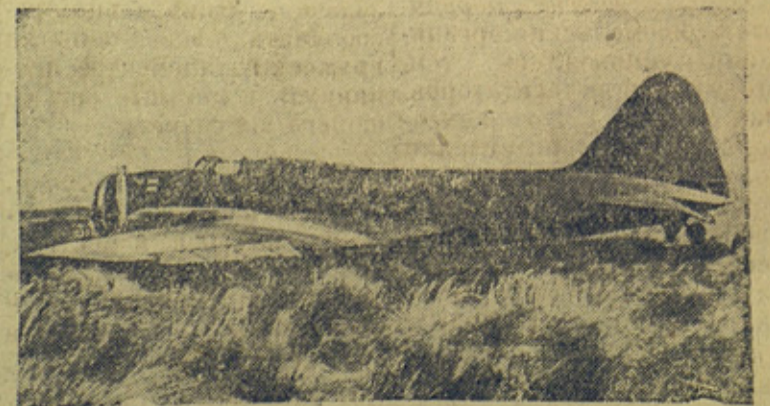
На снимке: Самолет «Москва» на острове Мискоу.

К беспосадочному перелету Москва — Северная Америка.