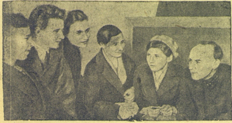
На снимке: Группа комсомольцев Москвы и Московской области, уезжающих на строительство.

По почину подтавских комсомольцев тысячи комсомольцев и молодежи едут на строительство ж. д. линии Акмолинск—Карталы—на одну из важнейших строек Третьей Сталинской Пятилетки.