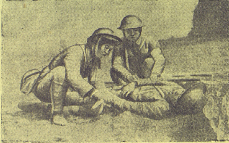
На снимке: Девушки-санитарки перевязывают раненого бойца китайской армии.

Китайские женщины принимают активное участие в борьбе своего народа против японских захватчиков. Они ведут большую агитационную работу среди населения прифронтовых деревень, ухаживают за ранеными бойцами, участвуют в военных операциях.