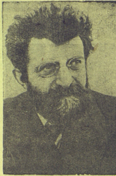
К 5-летию со дня смерти германского поэта Эриха Мюзам, замученного фашистами в концлагере (умер 30 июня 1934 г.). На снимке: Э. Мюзам (1878—1934 г. г.)

энергично бороться с мухами. Надо больше гулять с ребенком на воздухе, но не перегревая на солнце, во время прогулки одевать на голову ребенка белую шляпу или косынку, одевать в светлую, просторную одежду. Тщательно поддерживать чистоту в комнате ребенка, держать окна открытыми, не закутывать ребенка во время сна. Если у ребенка появился понос и рвота, немедленно покажите ребенка врачу. До совета с врачом не прикладывайте ребенка к груди и не кормите его. Каждые 15—30 минут давайте остуженную кипяченую воду или одну—две ложки чая. Если у ребенка холодные ножки—приложите к ним поверх одеяла хорошо закупоренную бутылочку с горячей водой, завернутую в пеленку, а на живот—нагретую пеленку или грелку. В комнате, где нахо-