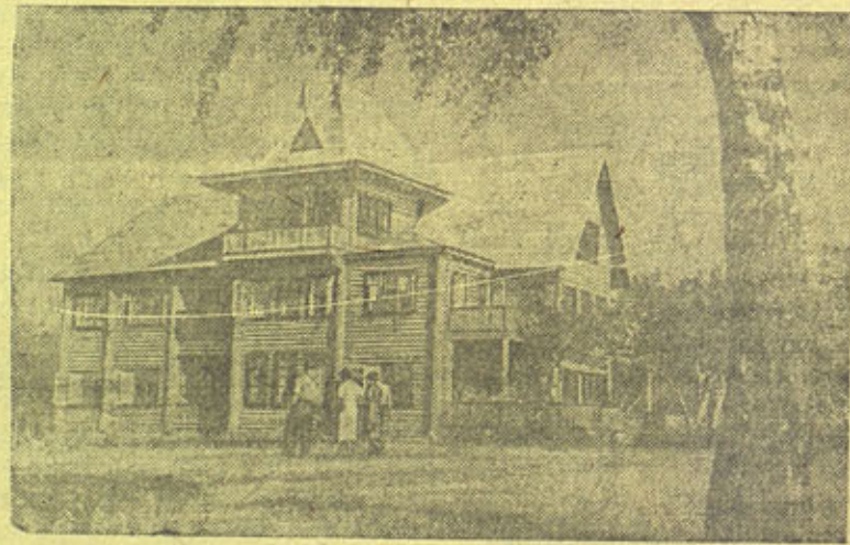
На снимке: Здание дома отдыха.

На живописном берегу Волги, в г. Васильевске (Горьковская область), в этом году открыт новый дом отдыха.