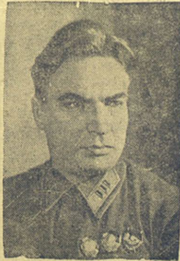
На снимке В. П. Чкалов.

К годовщине со дня смерти великого летчика нашего времени, Героя Советского Союза тов. Валерия Павловича Чкалова.