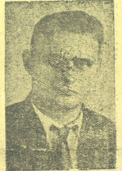
На снимке: Капитан ледокола „Седов“ Константин Сергеевич Бадигин.

ЦК ВКП(б) — тов. СТАЛИНУ СНК СССР — тов. МОЛОТОВУ