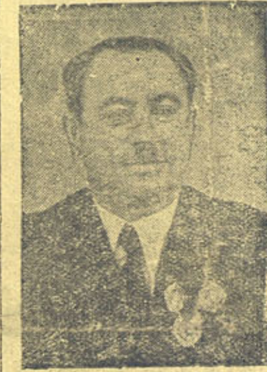
На снимке: Начальник экспедиции на ледоколе „И. Сталин“ — Герой Советского Союза тов. И. Д. Папанин.