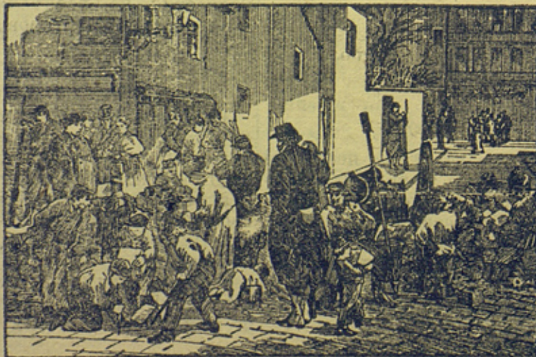
Постройка баррикады на одной из улиц Парижа.