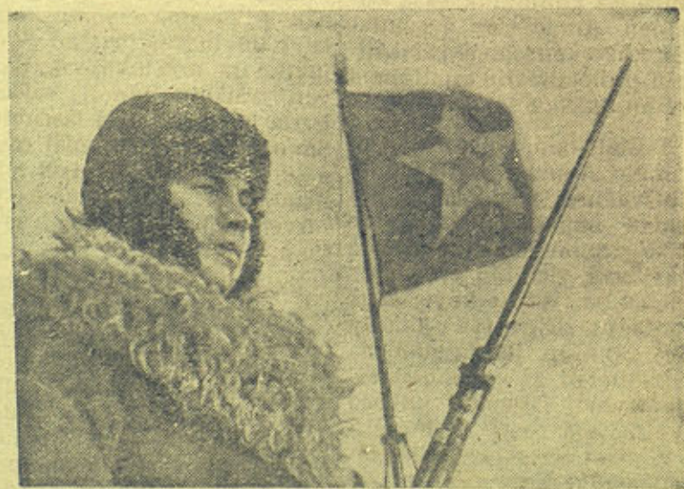
КРАСНОЗНАМЕННЫЙ БАЛТИЙСКИЙ ФЛОТ. НА сн: На вахте. PUNALIPPUINEN BALTIANMEREN LAIVASTO Kuvassa: Vahtipaikalla.