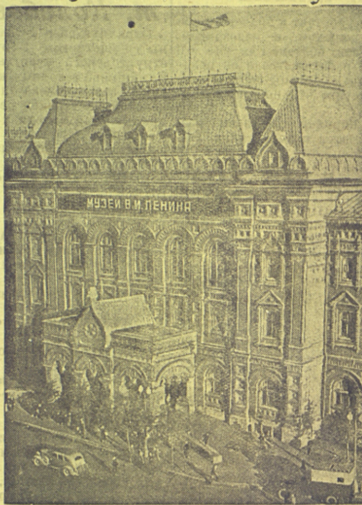
На снимке: Здание Центрального музея В. И. Ленина в Москве.