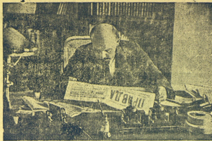
В. И. ЛЕНИН ЧИТАЕТ „ПРАВДУ“