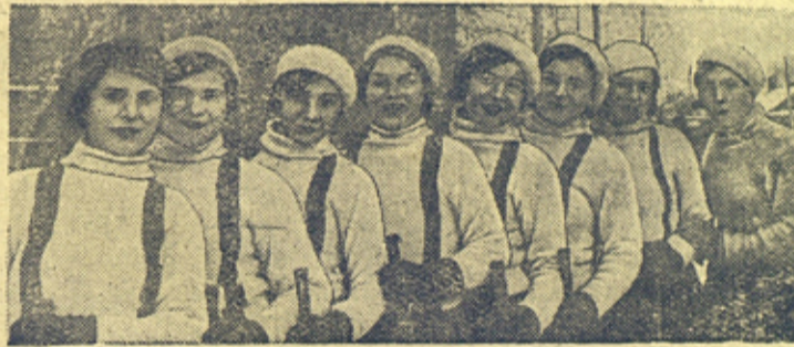
На снимке: команда на катке „Динамо“.

Девушки-физкультурницы команды „Рот-Фронт“ (г. Череповец, Вологодской области) в женском розыгрыше по хоккею заняли первое место.