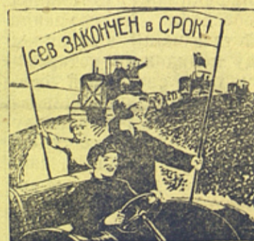
... едут по-полю герои!... Рисунок В. Баркова (по теме Ю. Левченко).