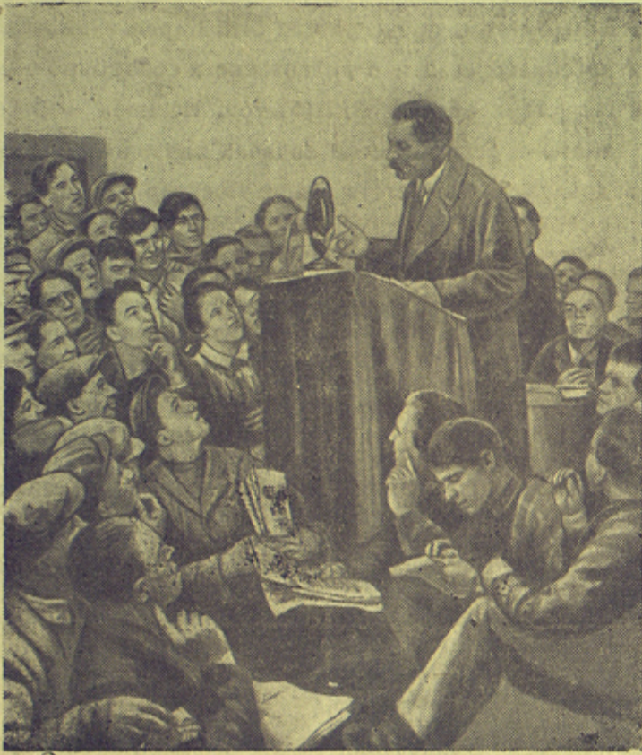
„Горький у рабкоров“ Репродукция с картины художника И. Бродского.