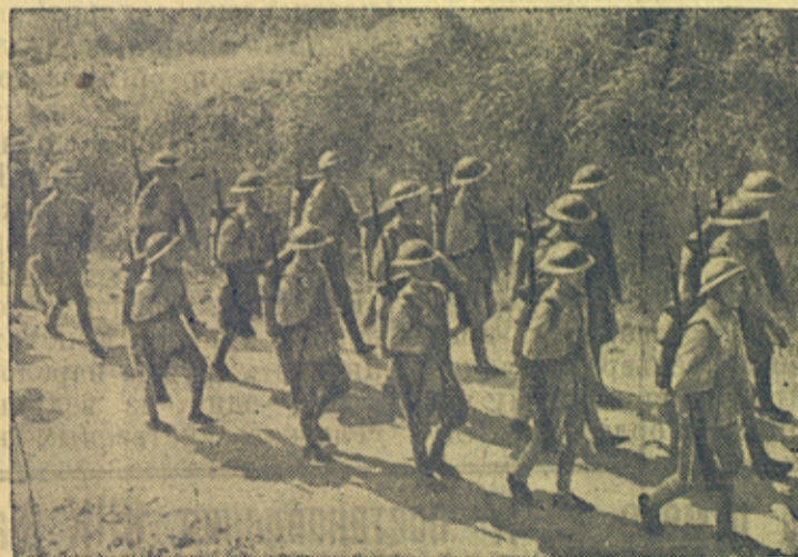
На снимке: отряд пехоты китайской армии отправляется на фронт.