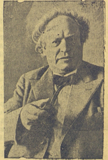
На снимке: Мартин Андерсен Нексе.

К 70-летию со дня рождения знаменитого датского писателя Мартина Андерсена Нексе (родился 26 июня 1869 г.)