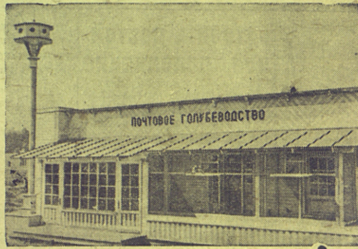
На снимке: Павильон „Почтовое голубеводство“.

На строительстве Всесоюзной сельскохозяйственной выставки (Москва).