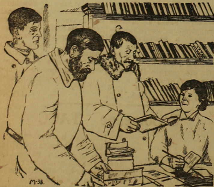
Библиотека колхоза „12 Октябрь“, Крестьянского района имеет 2150 книг. Регулярно получают книги из библиотеки 334 человека.