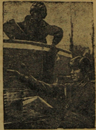
ЛВО. Танкисты на учебе