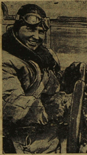
На снимке: 2-ой пилот самолета „РОДИНА“ капитан Полина ОСИПЕНКО.