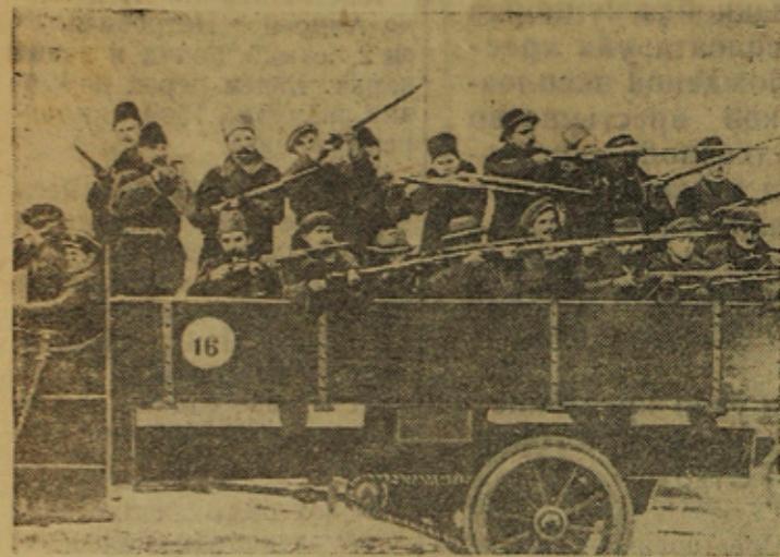
Красногвардейцы — путиловцы в Октябрьские дни 1917 года