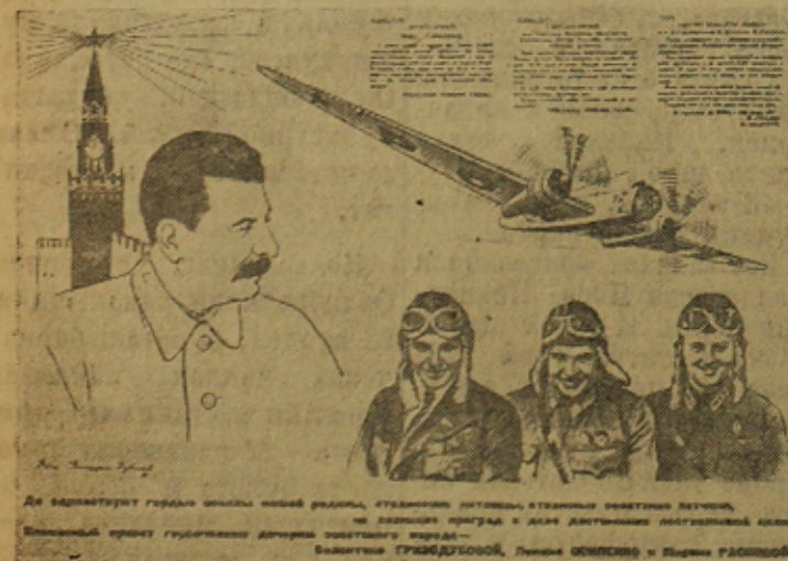
Плакат работы художников Дени, Долгорукова и Дуканова выпущенный издательством "Искусство" к приезду в Москву героического экипажа "Родина".

Омассах решениясеа сельпон руадаят оттуачеттых тӱвттӱв в. 1938 то-