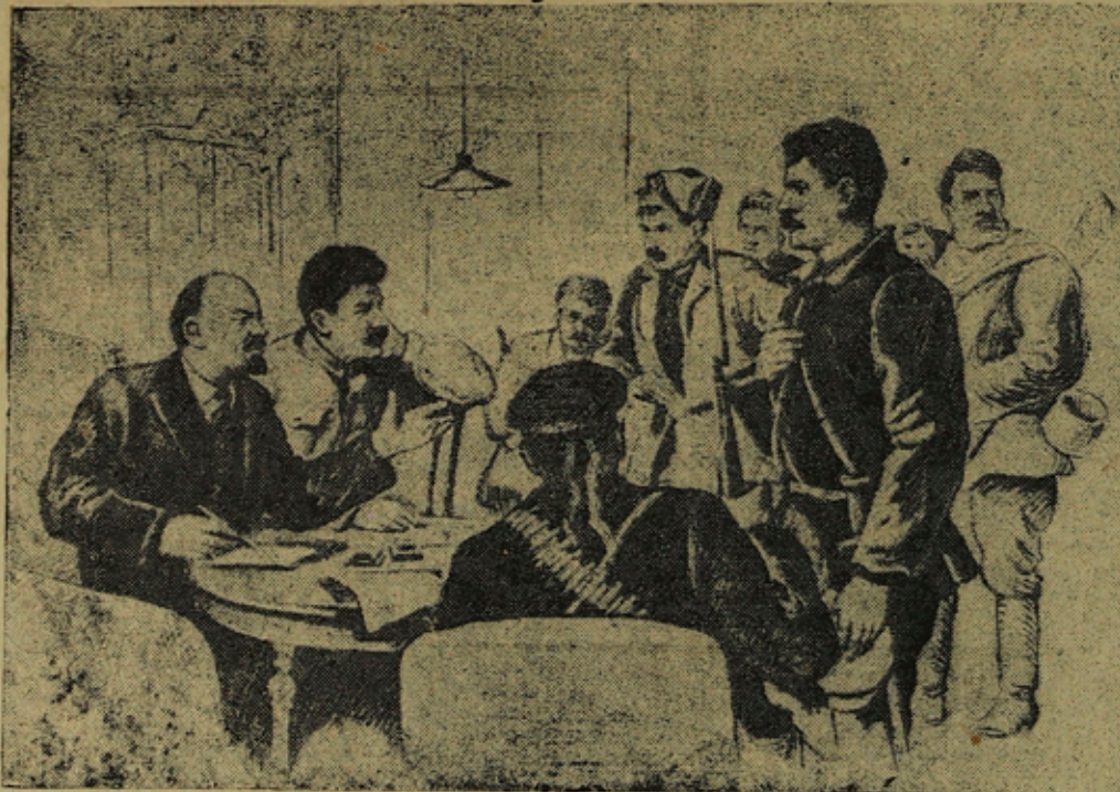
На сн.: В. И. Ленин и И. В. Сталин с красногвардейцами в Смольном. 1917 год

VI съезд партии проходил без Ленина. Владимир Ильич вынужден был скрываться от ищеек Временного правительства. Но Ленин руководил съездом через своих соратников и учеников — Сталина, Свердлова, Молотова, Орджоникидзе. Съезд по всем основным вопросам принял предложения