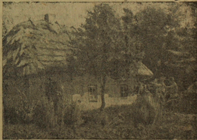
На родине поэта — в селе Шевченково, Ольшанского района (Киевская область).