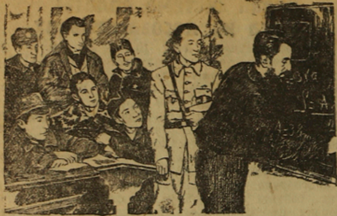
Штаб испанской республиканской армии организовал кружки для бойцов, в которых они повышают свой культурный уровень. На сн.: бойцы республиканской армии на занятиях в кружке.