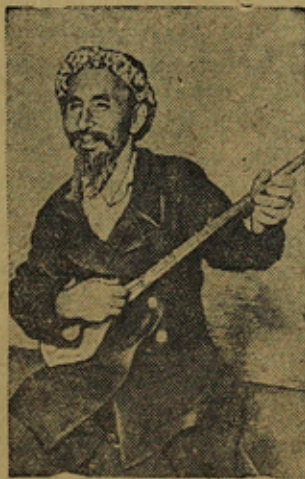
На сн.: народный певец Кара-Калпакин Джумагали Сигимбаев, 63 лет, поет под собственный акомпанимент на народном инструменте „Тутар“