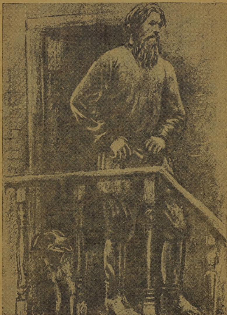
Гарасим лийкуматтомана сейзой кўннўксел.