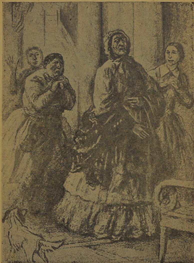
И, хиллякказех киӓндӓхӓ, лӓхти хӓн омах кабинеттах.