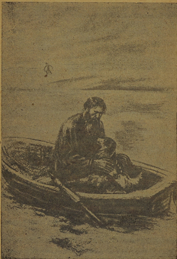
Венехтӓ аллот хиллякказин аеттих линнах пӓй.