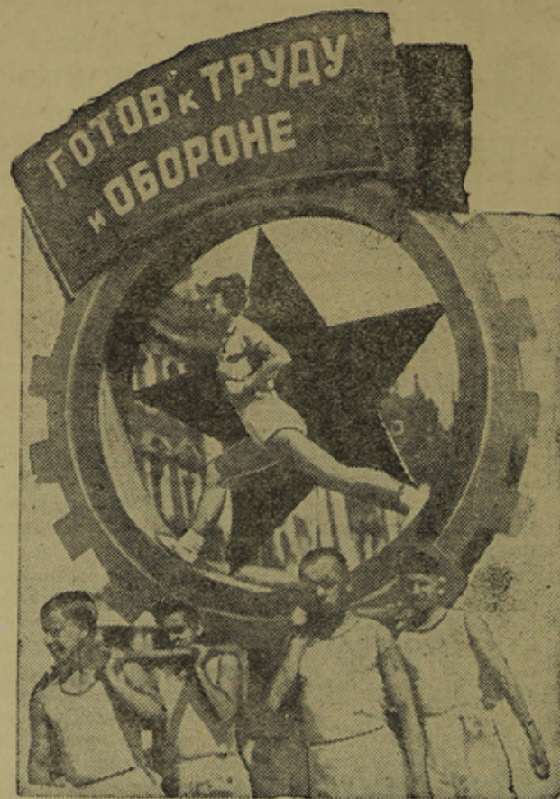
Nuorisomme oltava aina valmiina työhön ja puolustukseen