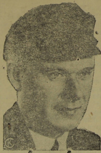
Вождь германских большевиков тов. Тельман, брошенный в тюрьму гитлеровской Германии.

„Государственная измена? Вы, сегодняшние властители, обвиняете меня в измене национал-социалистическому государству! Я не могу изменить тому, с чем я всегда всеми силами боролся. Вся моя жизнь принадлежит борьбе за свободу трудящегося народа и его молодежи, принадлежит борьбе за социализм. Делу народа я никогда не изменял и