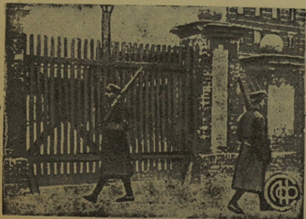
У ворот фашистских застенков.

В Палестине—убито 10, ранено 300, избито 2.000, арестовано 1.500, обыскано 165 человек.