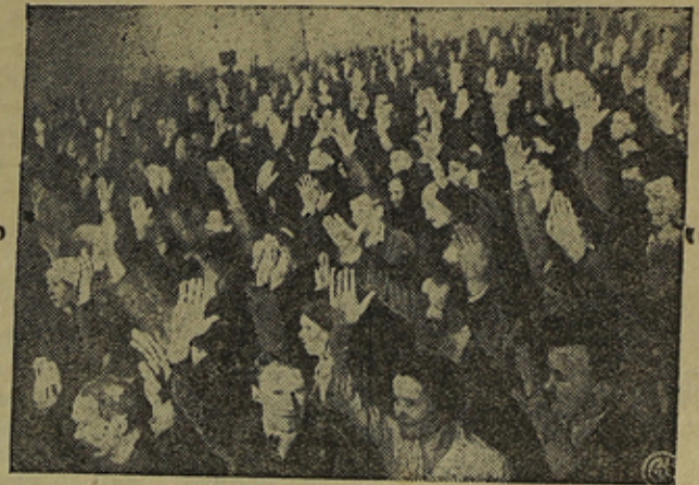
НА СНИМКЕ: Участники съезда голосуют за посылку приветствия тов. Сталину.