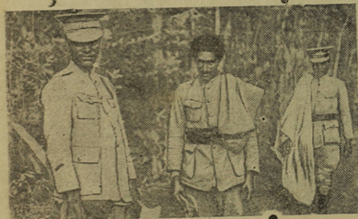
На снимке: абиссинские солдаты в Дессине.