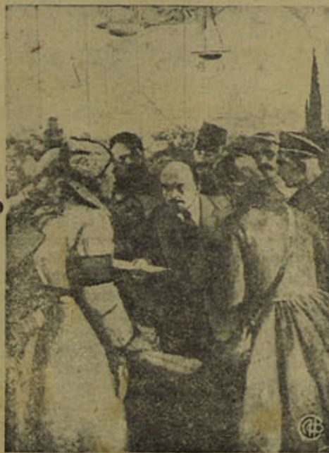
Второй Всероссийский съезд советов проходил в исторические дни — 7-8 ноября (25-26 октября) 1917 года. Съезд постановил: «вся власть на местах переходит советам рабочих, солдатских и крестьянских депутатов». Съезд образовал первый Совет Народных Комиссаров под председательством В. И. Ленина. На снимке картина художника Герасимова «В. И. Ленин среди крестьян-делегатов 2-го съезда Советов»

День конституции надо провести как большой народный праздник, как день всенародного обсуждения конституции, как день организующий массы трудящихся для достижения новых успехов.