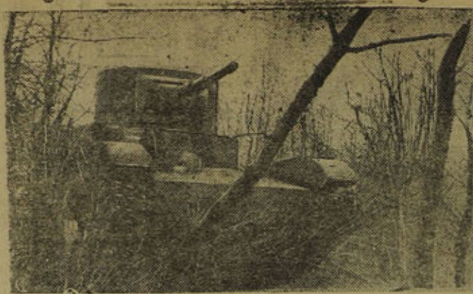
Танк из Аченин.