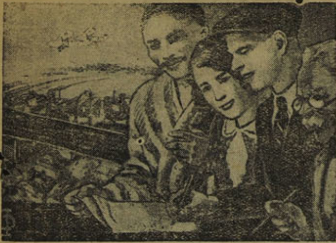
Рабочие и работницы! Инженерно-технические работники и служащие!

Дадим в займы нашему государству - двух трехнедельный заработок! Подпиской на заем Второй Пятилетки (выпуск четвертого года) усилим мощь нашей цветущей, счастливой и непобедимой родины.