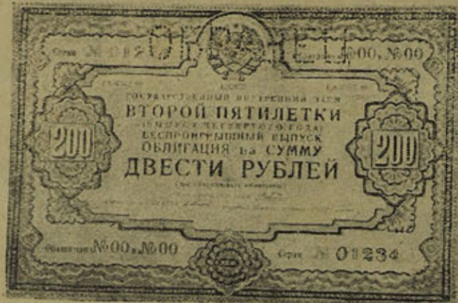
Образец облигации займа Второй пятилетки, выпуск 4 года

Обмен облигаций прежних займов на новый заем позволит направить на новое строительство не толь-