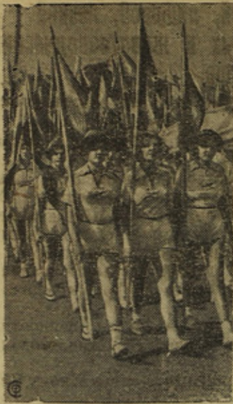
Областная колхозная спартакиада в Днепрпетровске. На спартакиаде с"ехались гости—физкультурники со всех областей, краев и республик Советского Союза.

На снимке: Физкультурники—участники колхозной спартакиады на параде