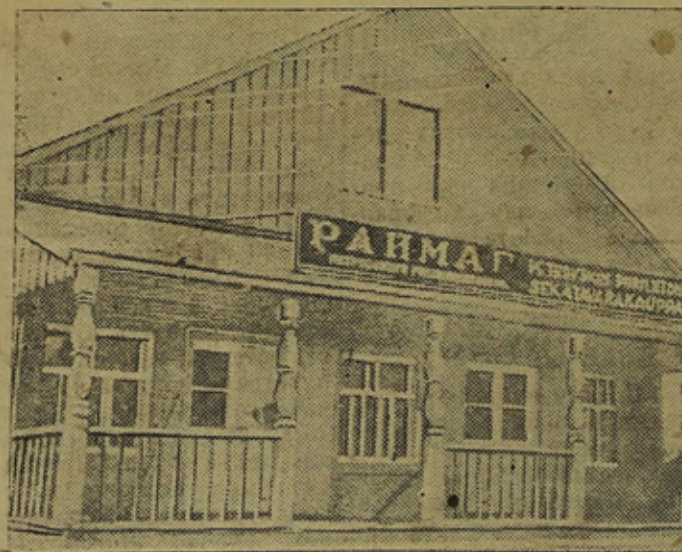
Районный универсальный магазин Райпотребсоюза Спасская-губа