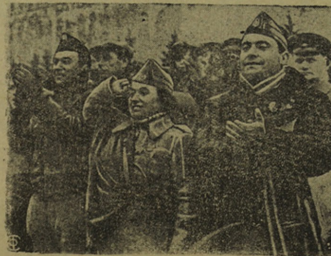
Празднование в Москве XIX годовщины Великой пролетарской революции. На снимке: Делегация трудящихся Испании на Красной площади.

Гибралтарский корреспондент газеты «Таймс» сообщает, что, как ему заявил англичанин, возвратившийся из Сеуты, «Союз водников» был оставлен в проливе крейсером «Альмиранте Сервера», приказавшим танкеру направиться в Сеуту. Крейсер «Альмиранте Сервера» приказал также выгрузить огромное количество нефти, находившейся на танкере.