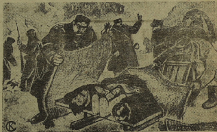
На снимке: Уборка полицией убитых в 1905 году.

Начало артиллерийского разгрома Пресни. Массовые аресты в Москве.