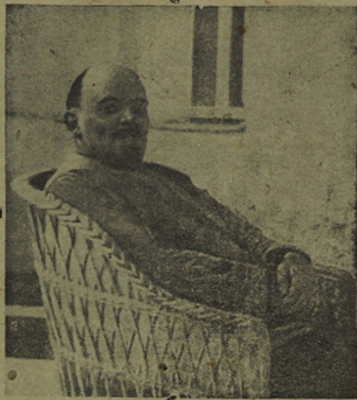
В. И. ЛЕНИН В ГОРКАХ (В КОНЦЕ ЛЕТА 1922 ГОДА)

Слеты стахановцев, совещания представителей партии и правительства с широким активом рабочих и работниц разных отраслей