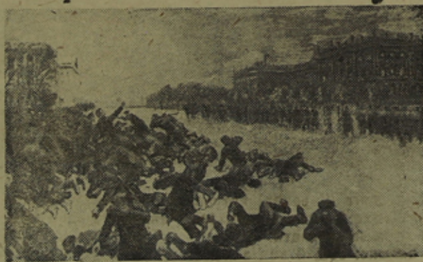
Расстрел у Зимнего Дворца

ским агентом—поном Гапоном, эта масса рабочих была убеждена, что есть мирный, "законный" бескровный путь избавления от рабочего рабства, нищеты и жесточайшей капиталистической эксплуатации. Достаточно послать "ходателей" от народа к царю или самим двинуться с покорными просьбами к царю, — и все пойдет по-иному. Так думали эти рабочие. Только ценой величайших потерь рабочие избавились от заблуждений. Расстреливая мирных, безоружных людей кровавыми псы царизма рассчитывали запугать пролетариат, но они просчитались.