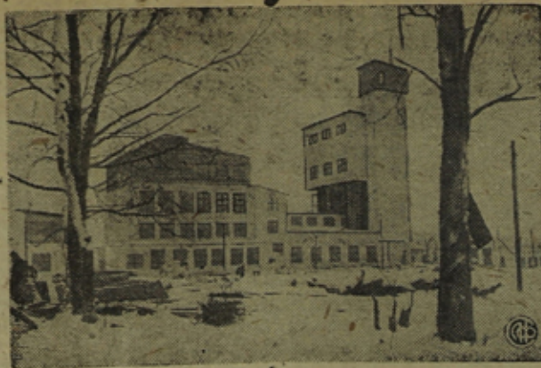
В Кондопоге (Карелия) вступил в пусковой период первый в С-юзе Пегматитовый завод, дающий сырье фарфоровой промышленности. На снимке: Общий вид завода.