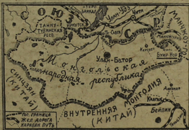
Карта Независимой Монгольской Народной Республики

Но "тот, кто ввязывается в новую империалистическую войну, может сломать себе шею и до осуществления своих захватнических планов". (Молотов).