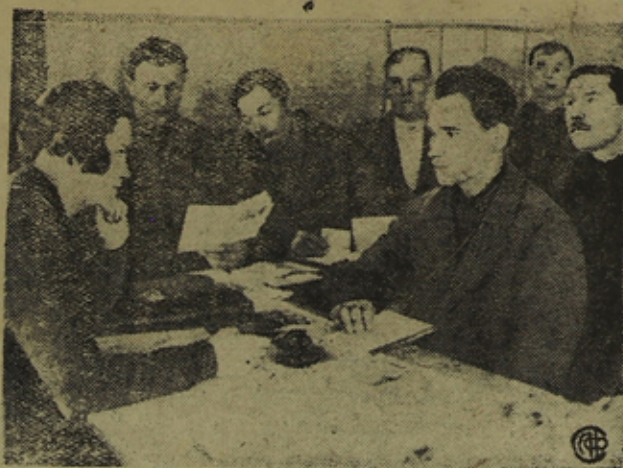
В колхозном клубе проходят курсы по яровизации.

колхоз „гнилище“, псковского района.