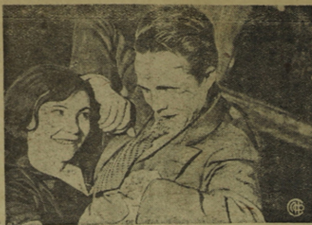
ЛЕНИНГРАДСКИЙ ТЕХНИКУМ СЦЕНИЧЕСКИХ ИСКУССТВ