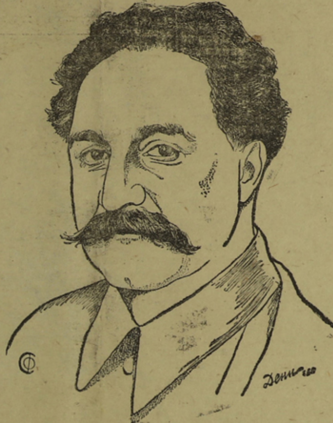
15 октября исполнилось 50 лет со дня рождения Народного Комиссара тяжелой промышленности Союза ССР Г. К. ОРДЖОНИКИДЗЕ

Такие же митинги и собрания состоялись и на других предприятиях Петрозаводска.