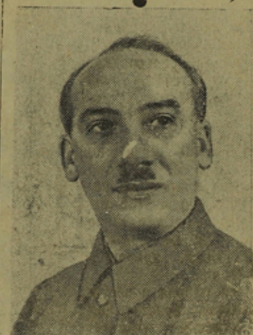
Генрих Григорьевич Ягода — Народный Комиссар Связи Союза ССР.