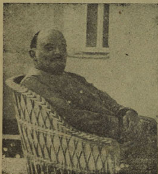
В. И. Ленин в Горнах (Мюльхейм) лета 1922 г.

В №-ре 6 от 17 января, в сообщении о курсах политпросветработ и в к о в указано: «открыты в а у т с я двухмесячные курсы», следует читать: «открываются двухгодичные курсы».