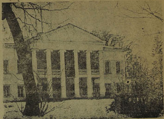
Дом в Горнах где умер В. И. Ленин