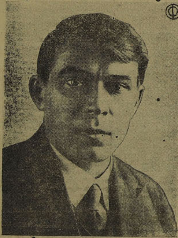
Генеральный секретарь ЦК ВЛКСМ тов. КОСАРЕВ

Затем в прениях по отчетному докладу Центрального Комитета ВЛКСМ и